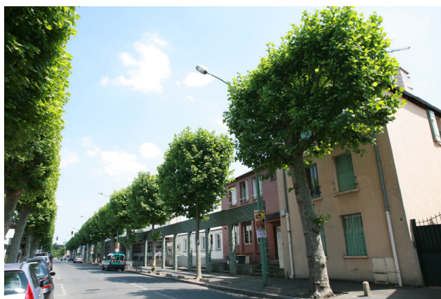
Platane en port libre et en port architecturé